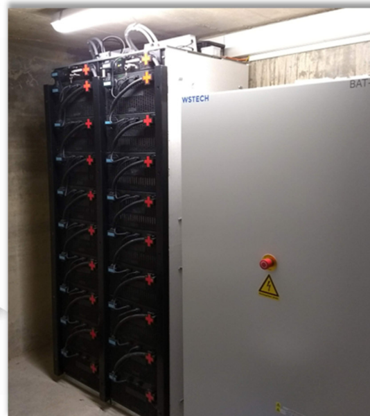
Batterie de stockage